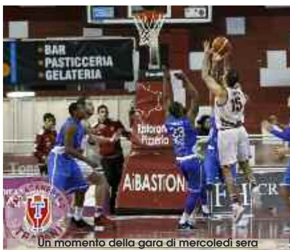
Un momento della gara di mercoledì sera